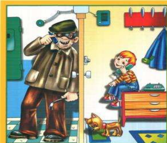
Не разговаривай и не открывай дверь незнакомым людям