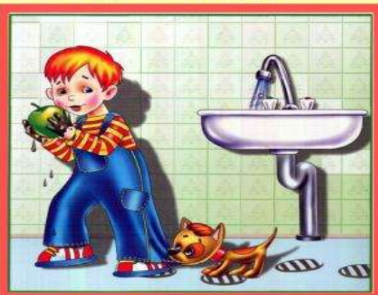
Мойте руки перед едой