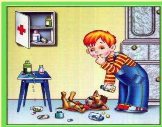
Не трогай таблетки